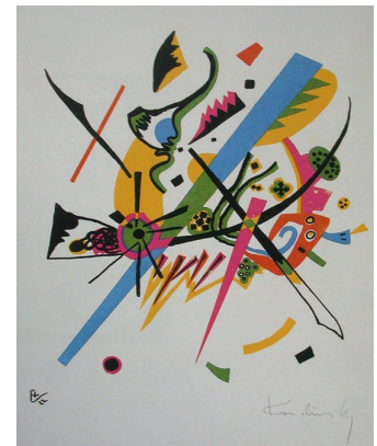
Vassily Kandinsky , Petit monde , 1922