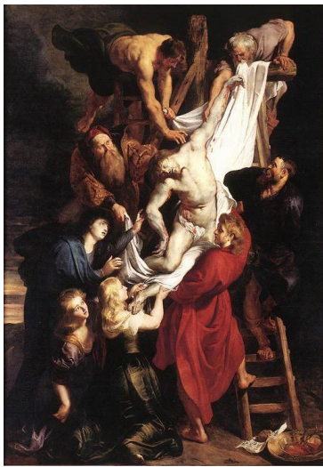
Pierre Paul Rubens Descente de croix 1612, 420 / 320 cm

Faites un croquis (en couleur si besoin) d'au moins 2 de ces œuvres.