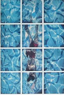
David Hocney pool 1972