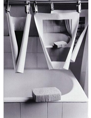
Claude Batho, éponge 1980