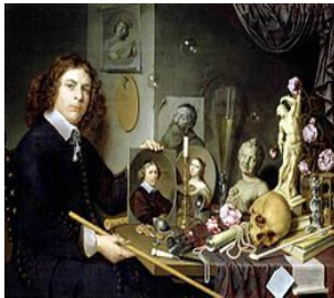
David Bailly Vanitas 1651

Faites un croquis en couleur de ces œuvres. Pour chacune, notez le nom de l'artiste, titres et date.